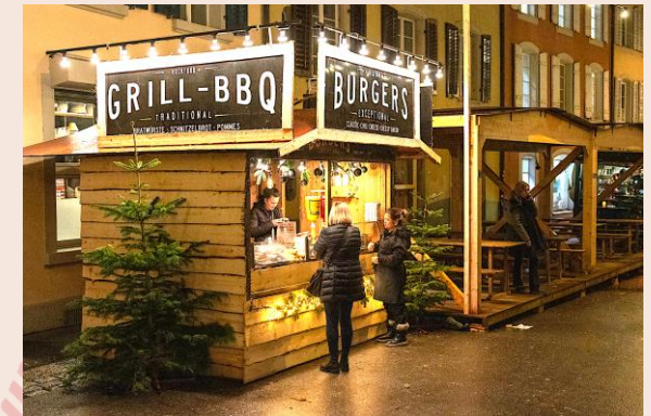
Zwischen den Toren

Zwischen den Toren: Entdecke den Altstadt Charme mit den günstigeren Stand-Optionen – ein exklusiver Ort mit einem intimen Rahmen für besondere Begegnungen.