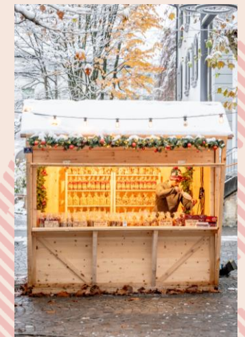
Variante mit Theke